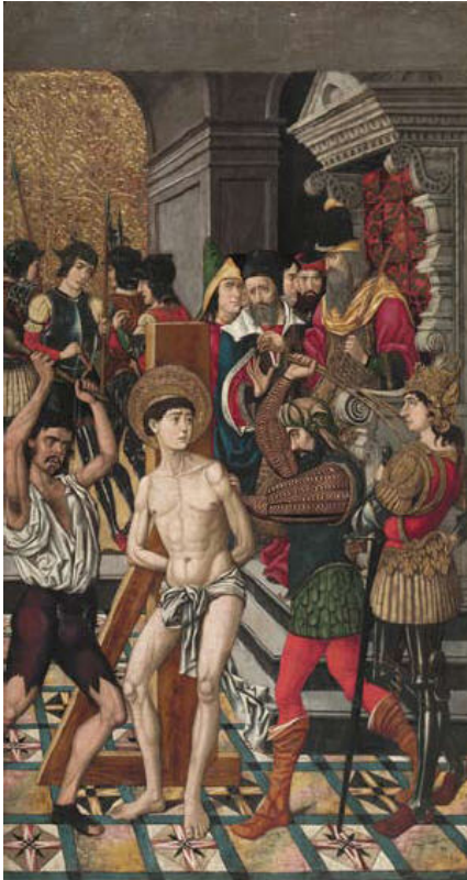
Mestre de Castelsardo, Flagel·lació de sant Vicenç , 185,6 x 98,2 cm