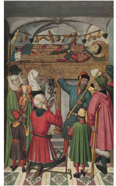
Jaume Huguet, Miracles pòstums de sant Vicenç , 165,8 x 97,4 cm