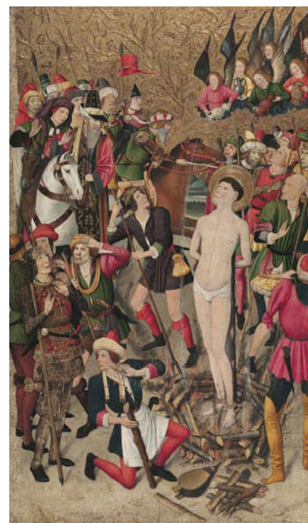
Jaume Huguet, Sant Vicenç a la foguera , 165,8 x 97 cm