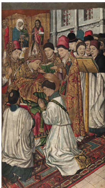
Jaume Huguet, Ordenació de sant Vicenç per sant Valeri, bisbe de Saragossa , 176 x 98 cm

No es coneixen dades sobre l'estructura original del retaule, que com a mínim tindria un total de dotze compartiments narratius dedicats al cicle hagiogràfic de sant Vicenç màrtir. A més, cal suposar que hi hauria una predel·la, amb els seus compartiments pictòrics i, fins i tot, hi podia haver dues portes amb les corresponents pintures.