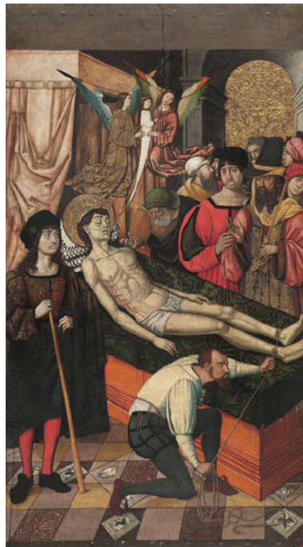
Mestre de Castelsardo, Mort de sant Vicenç , 176 x 97,5 cm

En el MNAC es conserva un total de nou compartiments del retaule de sant Vicenç, cinc van ser pintats per Jaume Huguet (Valls, cap a 1412 – Barcelona, 1492), tres pel Mestre de Castelsardo (actiu a Catalunya i Sardenya, finals del segle XV i primeres dècades del segle XVI) i un altre per un pintor anònim. Totes les taules són un dipòsit de la Junta d'Obra de Sarrià, de l'any 1903, procedent de l'església parroquial de Sant Vicenç de Sarrià.