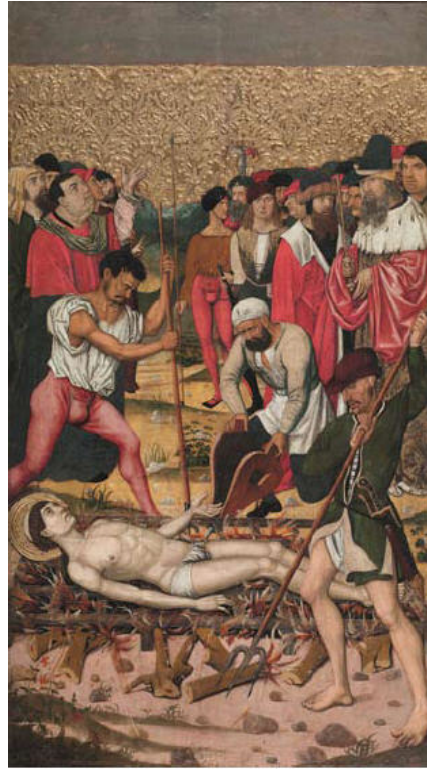
Mestre de Castelsardo, Sant Vicenç a les graelles , 175,8 x 97,3 cm