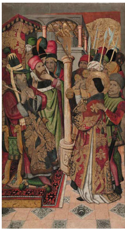
Jaume Huguet, Ordenació de sant Vicenç fa caure un ídol davant del prefecte Dacià , 176 x 97,8 cm